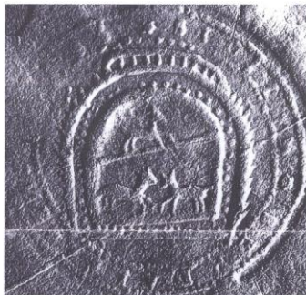
Pečať z roku 1685